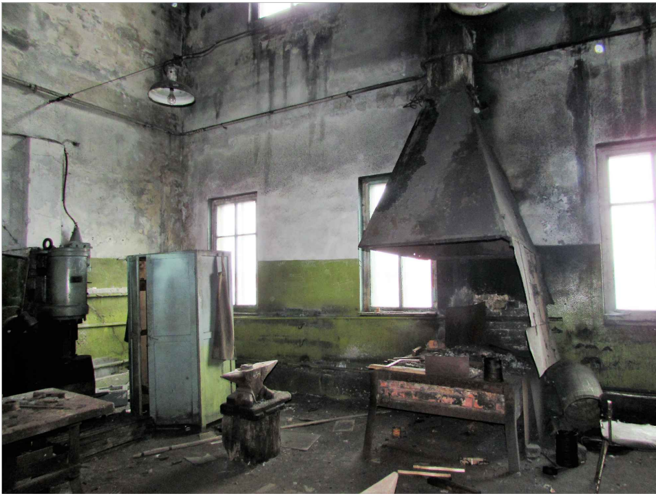
att. 41. Korpus 7. Skats Z gala telpā uz ārsienu.