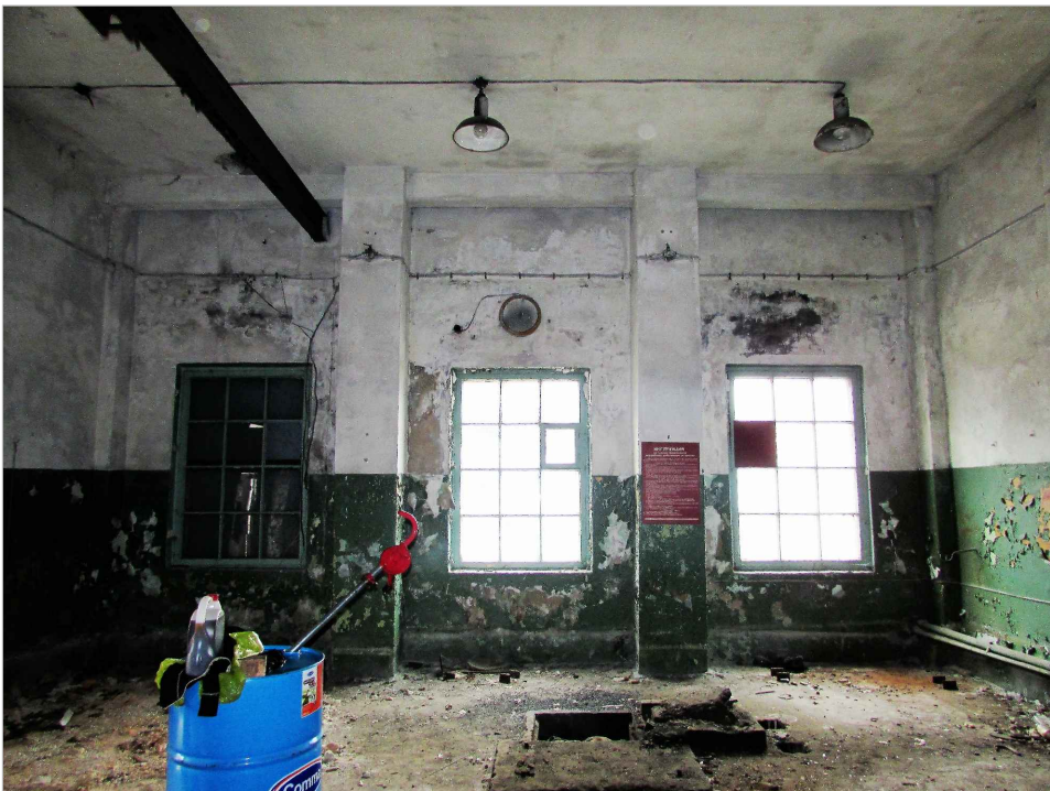
att. 44. Korpus 7. Skats D gala telpā uz ārsienu.