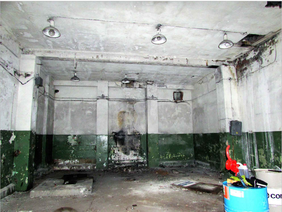
att. 43. Korpus 7. Skats D gala telpā uz starpsienu.