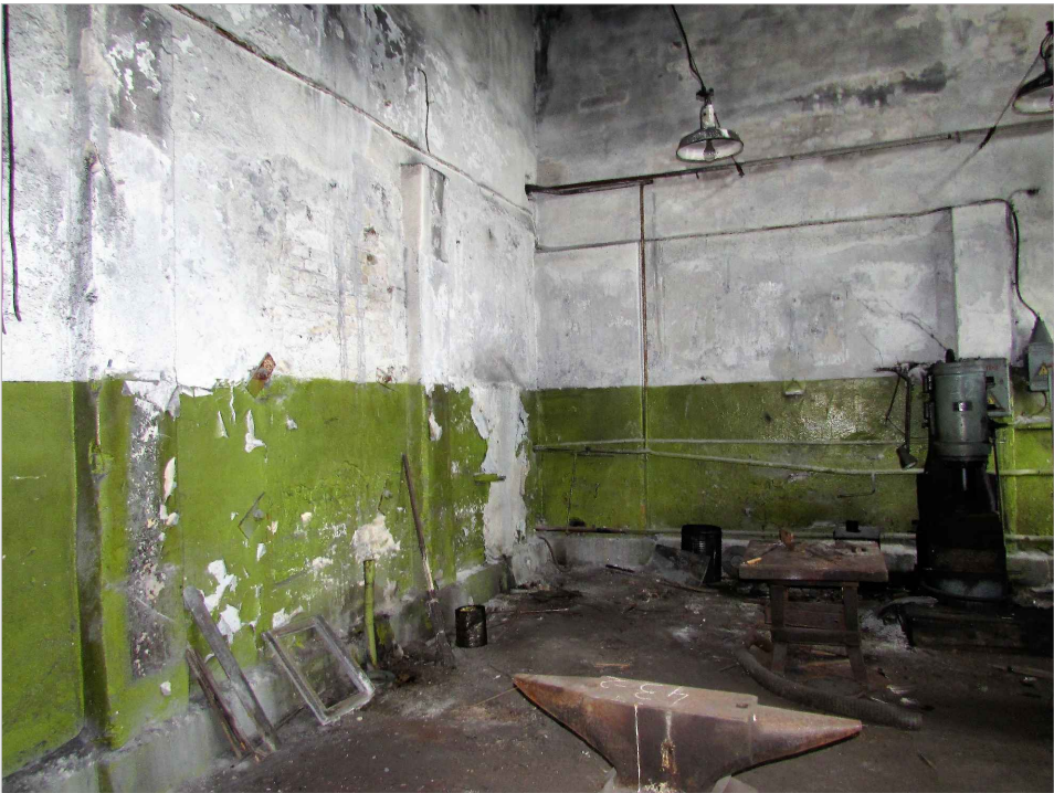
att. 42. Korpus 7. Skats Z gala telpā (smēde) uz starpsienu.